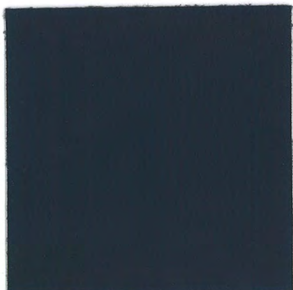
ネイビー RF-008 NEW